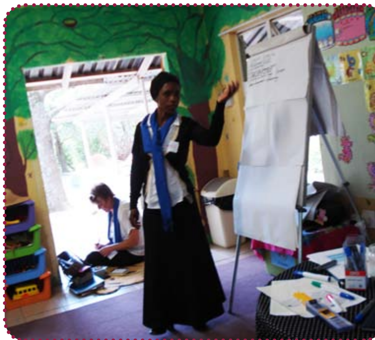
Over: Der bliver fremlagt for hele forsamlingen. Nederst: En pause i undervisningen i kommunikation og konflikthåndtering.

Ved sidste besøg hos CSHELP stod det også klart, at organisationen igennem projektets løbetid har udviklet sig til en meget stærk aktør på området for vold mod kvinder, og der arbejdes aktuelt på etablering af et såkaldt "safehouse", hvor voldsramte kvinder og deres børn kan få akut ophold, indtil der er udviklet en anden plan. I øjeblikket findes der ingen sådanne safehouses i Sisonke provinsen, som Creighton ligger i. RAW vil støtte opstarten af dette akut-krisecenter, hvis udfasningsprojektet går igennem, og imens forhandler CSHELP om en driftsoverenskomst med de sociale myndigheder i provinsen, så der kan sikres midler til den del af organisationens overlevelse fremover. Og vi giver heller ikke helt op i RAW! Hvis der kommer afslag på den aktuelle ansøgning om udfasningsprojekt, vil vi søge midler andre steder til at fortsætte samarbejdet med CSHELP i 2013. ■