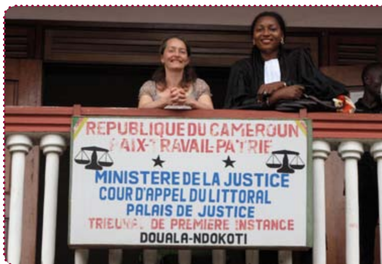
Repræsentanter fra RAW og WCIC ved appel domstolen i bydelen Ndokoti i Douala

"I ægteskabet er det mandens ret at administrere al fælles ejendom, det være sig sælge, belåne og disponere over den, uden kvindens samtykke eller vidende".